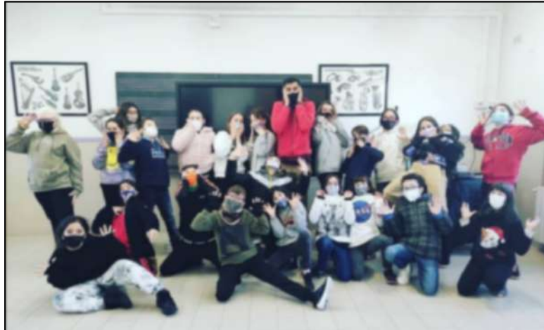
Escola El Pilar Premià de mar 2020 i 2021

Taller “píndola” de Impro teatral per primària