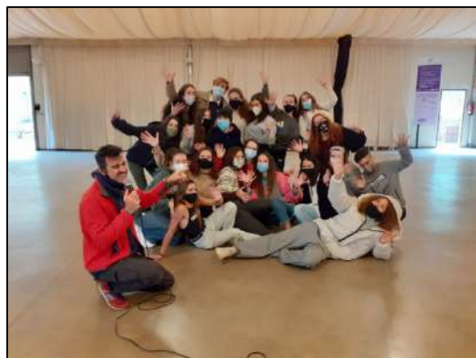
Institut LLUÍS DOMÈNECH I MONTANER Canet de 2021