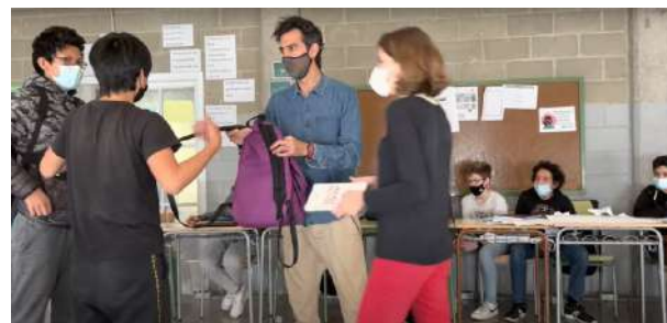
Taller sessió múltiple IES FORT PIUS 2022