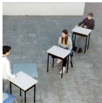
Taller mostra Escola Thau Bcn 2023