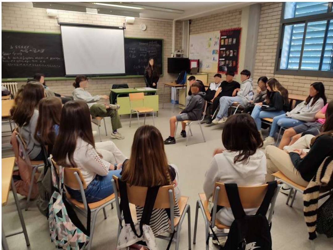
Taller sessió múltiple IES ARGENTONA 2022