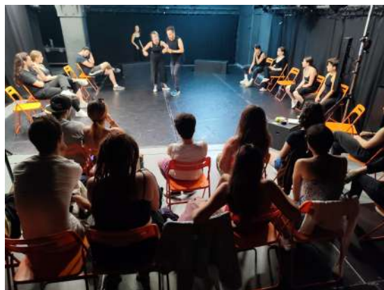
Workshops 2023-2021 escola AULES de Bcn.