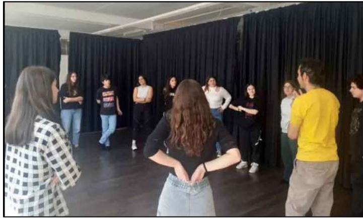
Institut LLUÍS DOMÈNECH I MONTANER Canet de mar 2023

Tallers de treball artístic combinant la Impro teatral i la música