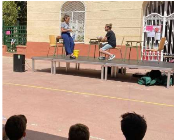
Jornades tallers IMPRO BULLYING d’ exterior i en sala